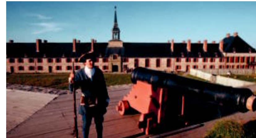
La forteresse de Louisbourg aux abords de Sydney en Nouvelle-Écosse

La forteresse de Louisbourg a été érigée pour protéger les intérêts de la France dans le Nouveau Monde. Aujourd'hui, elle palpite toujours