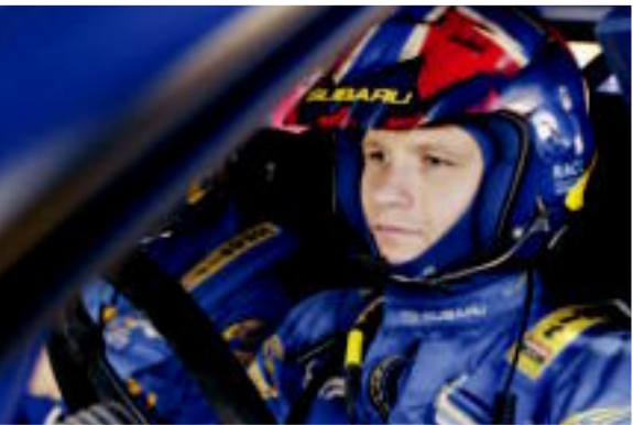
Entrevue avec Petter Solberg, champion du monde des rallyes 2003

La Revue Six Étoiles est produite par Subaru Canada, Inc. et vise à informer et à divertir les propriétaires de Subaru. Tous droits réservés. Le contenu de ce magazine ne peut être reproduit sans l'autorisation formelle de Subaru Canada, Inc. Nous nous réservons le droit de publier les lettres, opinions et articles qui sont envoyés à la Revue Six Étoiles. Subaru, Legacy, Outback, Impreza, Forester, WRX STi et B9sc sont des marques de commerce déposées de Subaru Canada, Inc. pour 2004.