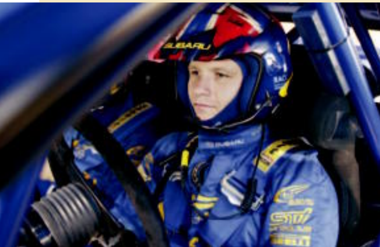
Petter Solberg, vainqueur du Championnat du monde des rallyes 2003

P rédiction : « Au cours des prochaines années, les courses de rallye devanceront la Formule 1 comme principale forme de course automobile! » Lorsque la source d'une telle prédiction est le charismatique Petter Solberg, grand vainqueur du Championnat du monde des rallyes 2003 et pilote de l'Impreza WRC de Subaru, on ne peut faire autrement que d'y croire.