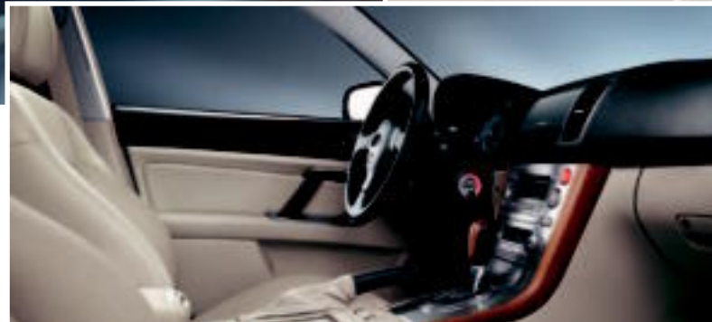
Du cuir luxueux offert en option pour l'intérieur de la Outback

Ressentez la différence. Le cadre et la voie élargis de la Outback, de même que ses nouvelles lignes voluptueuses, contribuent à sa performance tout en douceur et offrent une portance aérodynamique nulle pour une meilleure stabilité à vitesse élevée. Sentez la performance réactive de la commande électronique des gaz et de ses systèmes de freinage et d'échappement double