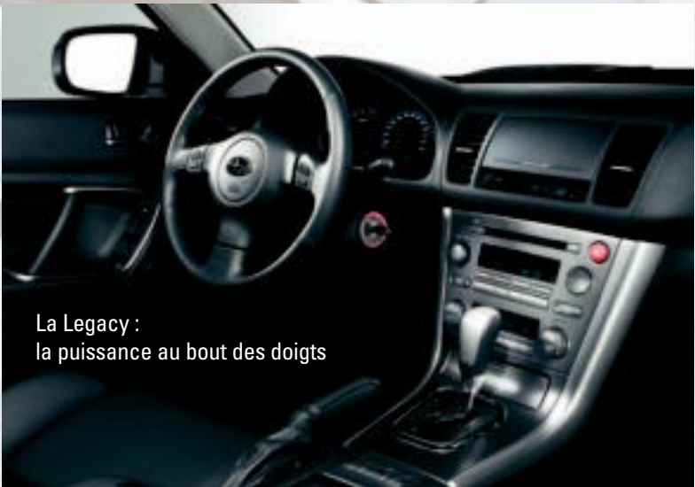
La Legacy : la puissance au bout des doigts

Peu importe le modèle Legacy que vous choisirez, vous bénéficierez du cadre sophistiqué d’un véhicule dont les performances ont été optimisées de A à Z.