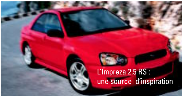
L'Impreza 2.5 RS : une source d'inspiration

L'IMPREZA 2.5 RS : VALEUR, PERFORMANCE, SÉCURITÉ. LA PREUVE QU'IL N'Y A PAS QUE LES APPARENCES QUI COMPTENT.