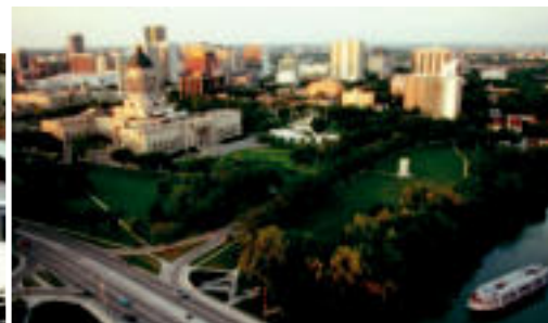
Winnipeg la magnifique