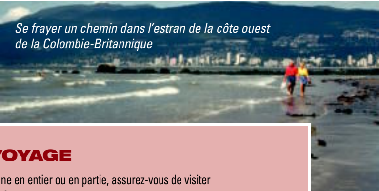
Se frayer un chemin dans l’estran de la côte ouest de la Colombie-Britannique

Après toutes ces aventures, vous serez prêts à vous la couler douce et à prendre le traversier du détroit de Georgie pour vous rendre à Nanaimo, sur l’Île de Vancouver, et de là, à prendre la direction sud jusqu’à Victoria. À ce moment, vous saurez que les 7 821 kilomètres que vous venez de parcourir vous auront fait vivre un voyage dont vous vous souviendrez toute votre vie et qu’ils vous auront réconcilié quelque peu avec ce long voyage accompli autrefois en compagnie de vos parents. Voilà qui est bien, car maintenant, peu importe d’où vous arrivez, vous devez refaire tout ce chemin en voiture pour retourner à la maison!