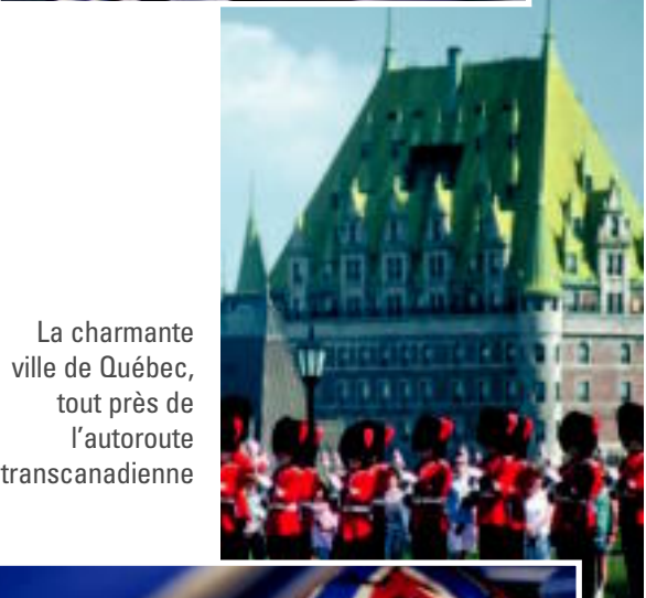
La charmante ville de Québec, tout près de l'autoroute transcanadienne