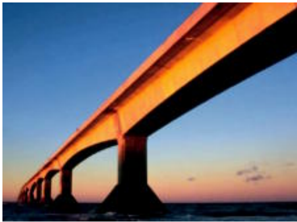
Le Pont de la Confédération franchit la distance entre l'Île-du-Prince-Édouard et le Nouveau-Brunswick

Officiellement inauguré en 1997, le Pont de la Confédération fait partie intégrante de la route transcanadienne. Couvrant 12,9 kilomètres, c'est le plus long pont au monde à franchir des eaux prises par des glaces. Sa construction a nécessité le concours de 5 000 travailleurs pendant trois ans et demi et son coût s'est élevé à un milliard de dollars. Ce montant vous rappelle quelque chose? C'est ce qu'il en a coûté, en 1970, pour construire la route transcanadienne au grand complet!