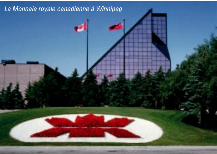
La Monnaie royale canadienne à Winnipeg

L'historique édifice de l'Est conserve le style du début de la Confédération et renferme les bureaux restaurés du tout premier ministre du Canada, Sir John A. Macdonald, ainsi que ceux d'autres hommes politiques de cette période. L'édifice de l'Ouest abrite quant à lui les bureaux des députés et est fermé au public!