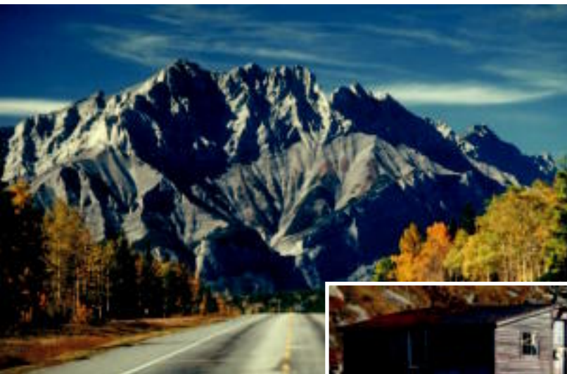
Scène albertaine le long de la route transcanadienne

En effet, il n'existe pas de meilleure façon de visiter le Canada que de parcourir les 7 821 kilomètres de cette route qui débute à St. John's, Terre-Neuve, traverse 5 fuseaux horaires, 10 provinces, la ligne continentale de partage des eaux, et emprunte plusieurs traversiers avant de terminer son parcours à Victoria, en Colombie-Britannique.