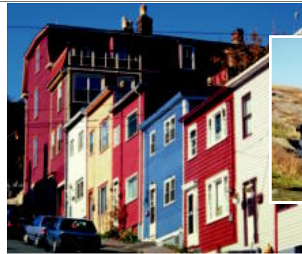
À Terre-Neuve, admirez les rues colorées de St. John's.