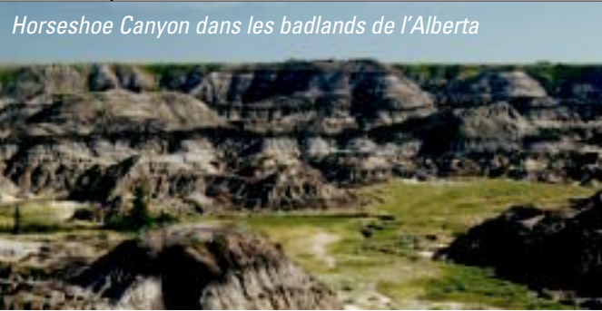
Horseshoe Canyon dans les badlands de l’Alberta

En traversant une nouvelle frontière provinciale, on découvre certains des plus impressionnants paysages canadiens à caractère historique. Ceux-ci se trouvent juste au nord de la route transcanadienne dans les badlands de Drumheller et au parc provincial Dinosaur. Cette région que constituent les « badlands » de l’Alberta est d’une beauté et d’une richesse historique presque inconcevables. C’est ici qu’ont été réalisées les plus grandes découvertes au monde concernant les dinosaures. La formation des badlands est due à la création de grandes rivières par suite du recul des derniers glaciers, ce qui a creusé des chenaux d’écoulement à travers la roche tendre. Avec le temps, ces chenaux ont été sculptés et façonnés par le vent, mettant au jour des restes fossiles de faune et de flore anciennes.