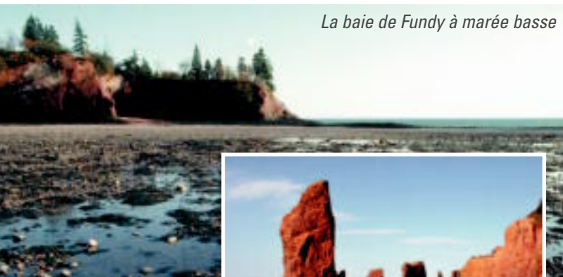
La baie de Fundy à marée basse

cet endroit, les marées — un phénomène causé par l'influence gravitationnelle du Soleil et de la Lune —, franchissent le goulet de la baie produisant ainsi les plus fortes marées au monde. Leur amplitude peut atteindre plus de 14 mètres, soit la hauteur d'un édifice de quatre étages. Deux fois par jour, 200 milliards de tonnes d'eau — l'équivalent de l'eau qui coule dans toutes les rivières du globe — s'engouffrent dans la baie pour ensuite en ressortir. À marée basse, vous aurez le loisir d'explorer les rochers couronnés de verdure qui ressemblent à des pots de fleurs, de même que les cavernes et les tunnels sculptés dans des formations géologiques apparues des millions d'années avant les Rocheuses. Quelques heures plus tard, vous pourrez voguer dans un kayak à l'endroit même où vous venez de marcher!