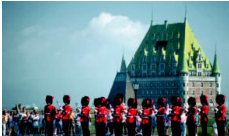
Apparat militaire dans les remparts du Vieux-Québec

À quelques kilomètres de là, la route transcanadienne embrasse le sud de la grande province de Québec et longe le fleuve Saint-Laurent. Bien qu'elle ne soit qu'effleurée sans être traversée, la ville de Québec vaut assurément le détour. Seule ville fortifiée d'Amérique du Nord, elle figure sur la très sélecte liste du patrimoine mondial de l'UNESCO. Empruntez ses rues pavées sinueuses et découvrez des maisons et des églises de pierres datant du XVII e et du XVIII e siècle, des parcs magnifiques, des places et d'innombrables monuments!