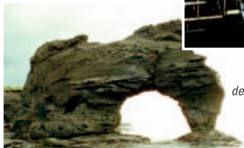
Un peu de magie des Maritimes