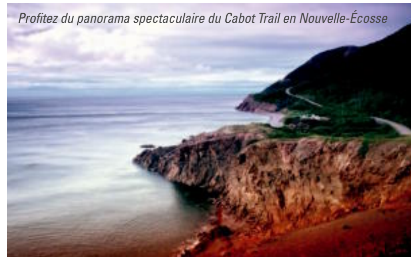
Profitez du panorama spectaculaire du Cabot Trail en Nouvelle-Écosse

Il va sans dire que sa péninsule de plus de 580 kilomètres fait de la Nouvelle-Écosse l'une des plus jolies provinces du Canada. Juste à l'est du port de Sydney, on découvre le parc historique national de la Forteresse-de-Louisbourg, la plus importante des reconstitutions historiques jamais réalisées au Canada.