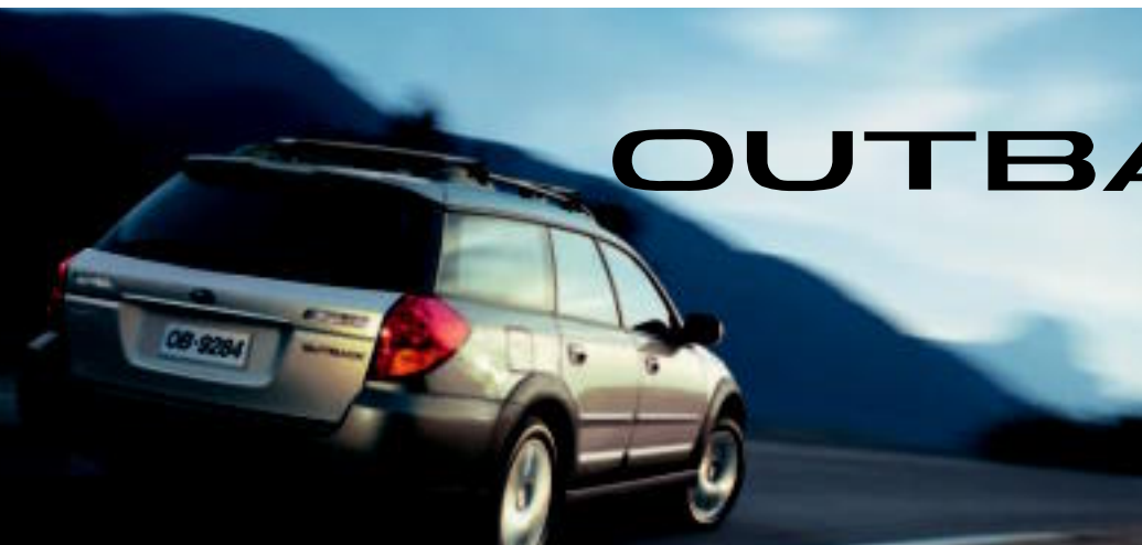
La Outback : la sportive utilitaire familiale tout-terrain