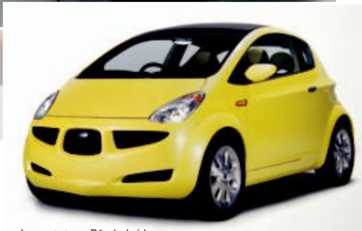
Le prototype R1e hybride

L'historique édifice de l'Est conserve le style du début de la Confédération et renferme les bureaux restaurés du tout premier ministre du Canada, Sir John A. Macdonald, ainsi que ceux d'autres hommes politiques de cette période. L'édifice de l'Ouest abrite quant à lui les bureaux des députés et est fermé au public!