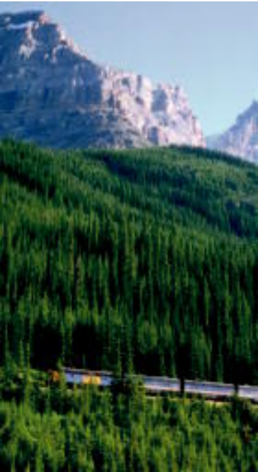
Se promener sur les rails à travers les Rocheuses

préciser que nombreux sont ceux qui n’ont pas survécu à cette épreuve casse-cou. L’année 1907 marqua le début des travaux sur deux tunnels en forme de spirale, avec des rails qui s’entrecroisaient pour former un huit. Ces tunnels zigzagants ont prolongé la ligne de chemin de fer et ont réduit l’inclinaison de près de la moitié. Il s’agit de nos jours des seuls tunnels du genre en Amérique du Nord. Aujourd’hui, des belvédères jalonnent la route transcanadienne et si vous vous y trouvez au moment du passage d’un train, vous aurez la chance d’admirer une pure merveille d’ingénierie.