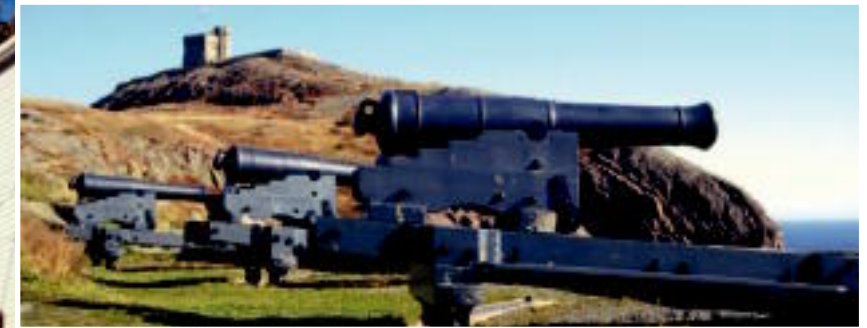
Les canons veillent silencieusement sur St. John's depuis Signal Hill.